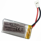
LiPo Akku 3,7V 300mAh A110/AM38/AMB74 Art.-Nr.: 045-24077-10